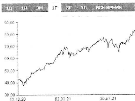
Нефть (Brent) График в USD - 1 Год