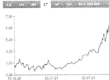
Природный газ (Henry Hub) График в USD - 1 Год